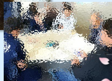
令和8年度の 両小PTA会長も 祭デザイナー！！