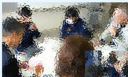
秋葉区 長崎区長も 祭デザイナー！

祭デザイナーを中心に、地域の新たな祭である「こあいまつり」が8月1日(土)に開催されます。第0回の会議(準備会)が開催され、大人20名以上が参加し、総勢40名規模の祭デザイナーとなりました。祭デザイナーは今後も絶賛募集中。