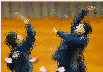
全力で楽しむ生徒たち

この日は、体育祭の各係活動も同時に行われていたにもかかわらず、全校の約4分の1もの生徒が体育館で汗を流していました。先輩と後輩とがかかわる姿は、普段とはまた異なった、素敵な雰囲気でした。