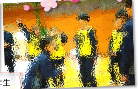
生徒会執行部の企画を全力で楽しむ3年生