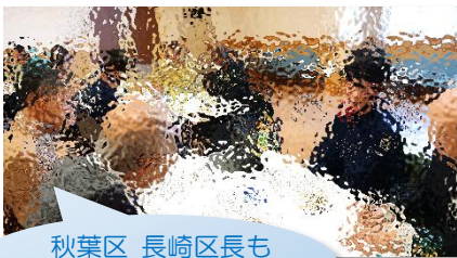
秋葉区 長崎区長も参加してくれました