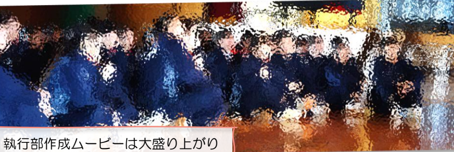
執行部作成ムービーは大盛り上がり