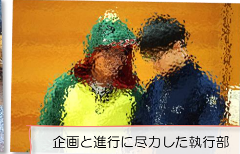
企画と進行に尽力した執行部

みなさんの創造力と行動力には、本当に感心させられます。冒頭のレクリエーションでは、全力で楽しみ、わわくを爆発させているみなさんの姿に、私も嬉しくてたまらなくなりました。わずかの休憩時間なのに待たずに勝手に大相撲大会を始めてしまう3年生。でもそこが3年生らしいのですよね。1、2年生も、そんな楽しんでくれている3年生をみて、とても嬉しかったことでしょう。3年間を振り返ろうクイズやスライドショーは、嬉しくもあり、懐かしくもあり。きっと3年生にとって、素敵な時間となったのでは。